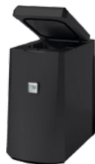
TM 1 L Milch - Peltierkühler schwarz