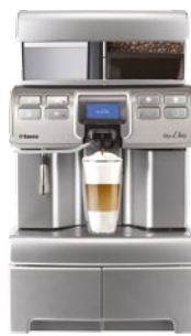
Aulika High Speed Cappuccino Festwasser