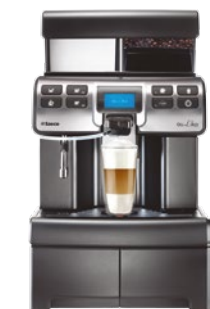
Aulika High Speed Cappuccino Tank schwarz

Zahlungssystem Münzprüfer, zwei Getränkepreise programmierbar (optional)