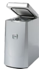
TM 1 L Milch - Peltierkühler silber